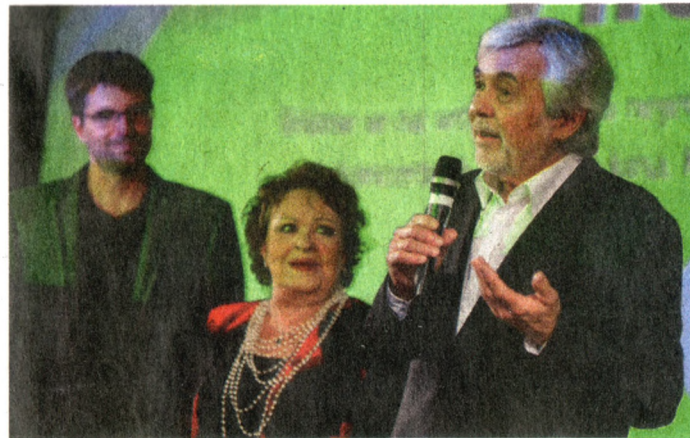
JIŘINA BOHDALOVÁ a Josef Abrahám, dvě osoby na festivalu.