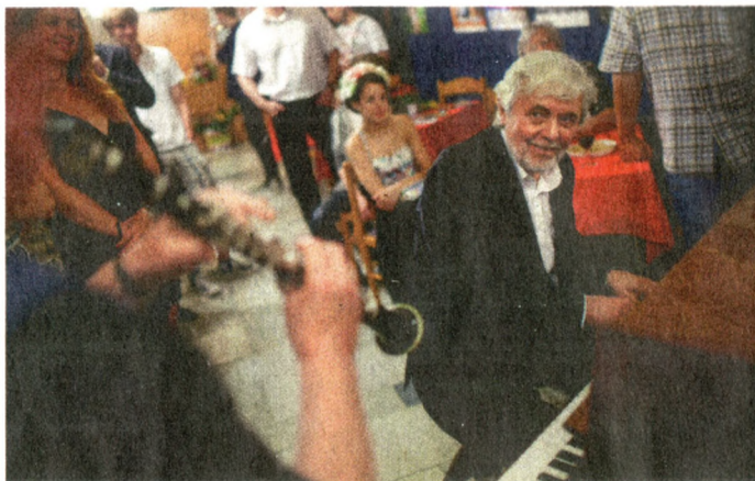
JOSEF ABRHÁM hraje na piano po skončení slavnostního zahájení.

Na zahájení i během festivalového dění mohli návštěvníci potkat i řadu dalších osobností, nechyběli samozřejmě členové poroty. Novou členkou je letos herečka Tereza Brodská. Tradičně už přijeli režisér a scenárista Zdeněk Zelenka, akademický ma-